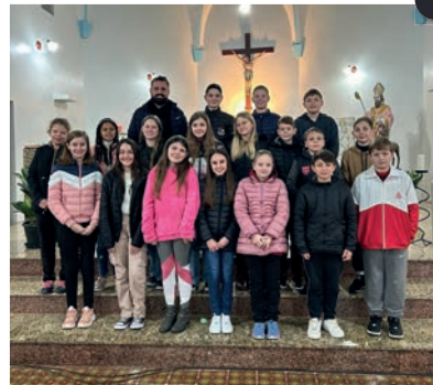
Boa Vista do Buricá/SC