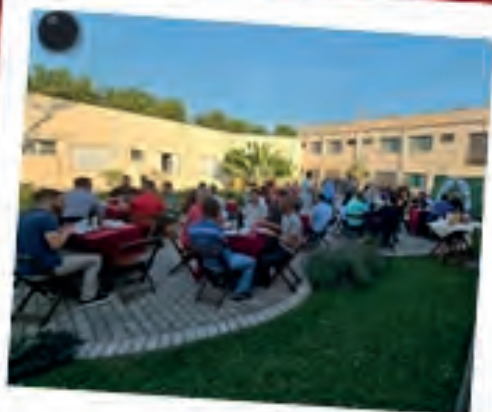
Café com a Casa Dom Couto