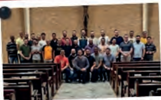
Retiro de Formação Humana com o Instituto Chiara Luce