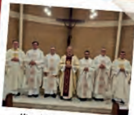
Missa de posse para o 2º Triênio do Superior Provincial BSP e seu Conselho